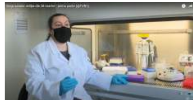
Organizare interviu TVR1, Viața satului, pentru edițiile emisiunii În grădina Danei difuzate în 28 martie și 23 mai 2021