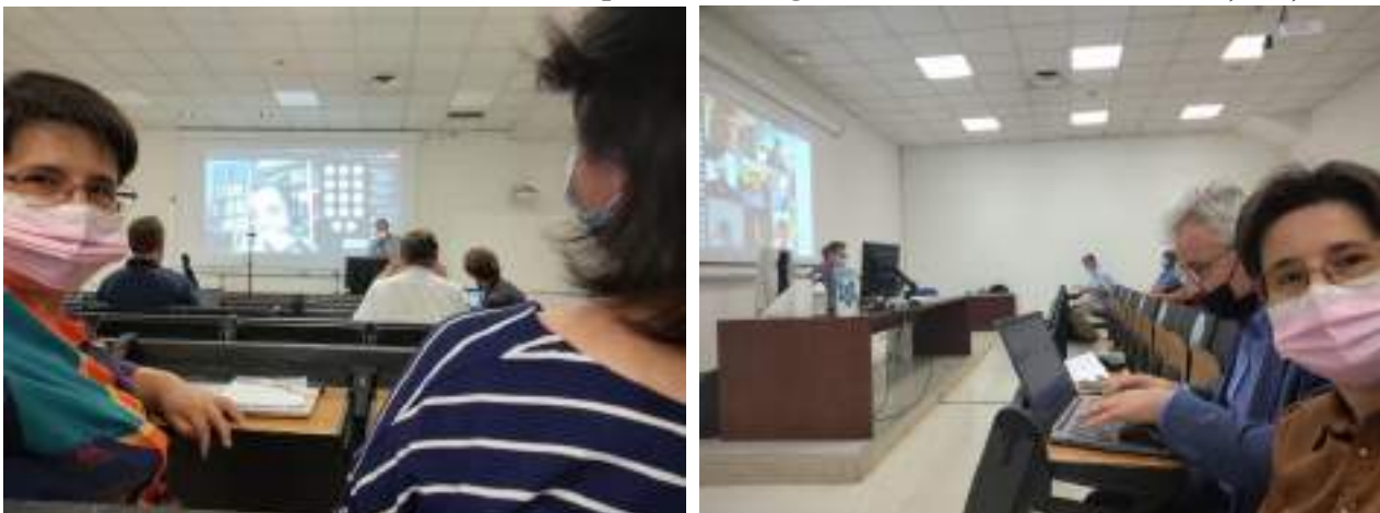
Eufrin workshop on innovative, sustainable orchard management. Bologna, Italia, 14-16.9.2021