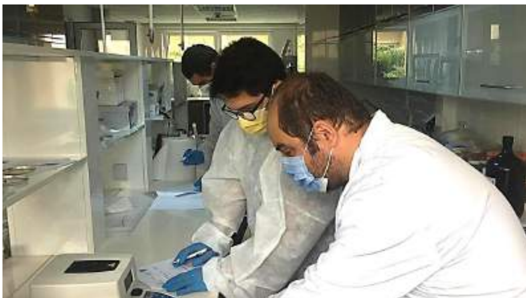
Aspecte din laborator, lucrări practice masteranzi