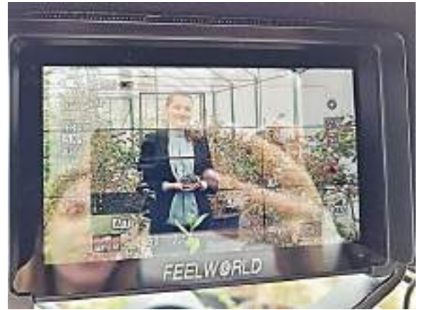
Organizare interviu TVR1 Secretele Plantelor, 20-21.09.2021