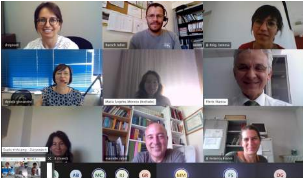
Întâlnire de lucru pe proiectul EUFRIN, EUFRIN WG Apricot and Peach, 26.10.2021