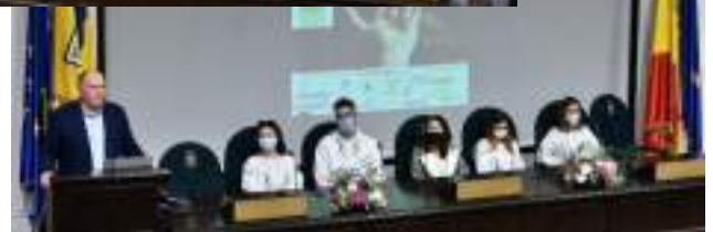
Organizare One Health Student International Conference, 25-26.11.2021, USAMV București (online)