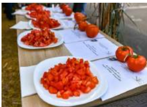
Expoziție de tomate cu degustare în cadrul târgului "Toamna Horticola Bucuresteană", 30.09.2021, USAMV București