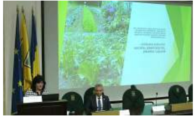
Organizare și prezentare la evenimentul UNESCO "Ziua Internațională a Biodiversității/ Protejează resursele naturii", 20.05.2021, USAMV București