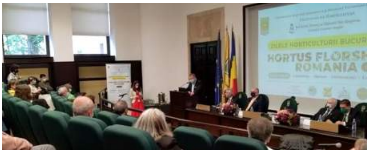
Zilele Horticulturii Bucureștene - Hortus FlorShow 2021, 13-16.05. 2021, hibrid