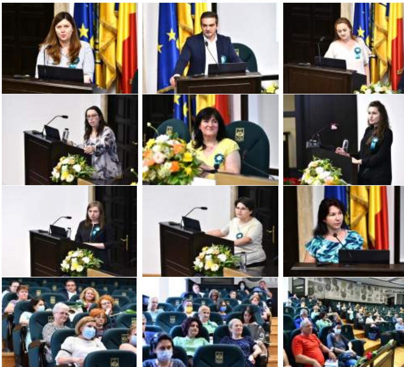
Organizarea Aniversării ”Cercetare Științifică de Excelență la Centrul de cercetare pentru studiul calității produselor agroalimentare 2016-2021”