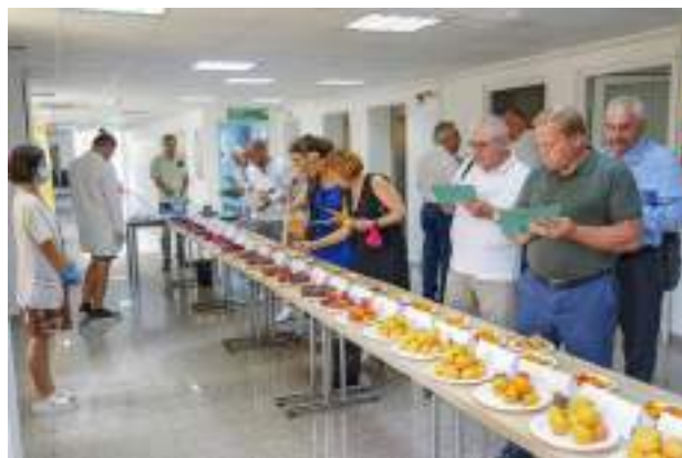
Degustare fructe și evaluare (cais, piersic), 23.07.2021