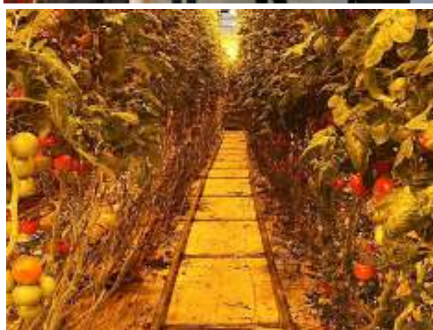
Vizita de lucru pe proiectul "Energy-efficient climate control of a greenhouse for increased productivity", acronim ClimaGreen, 19 – 26.11.2021, Oslo și Trondheim, Norvegia