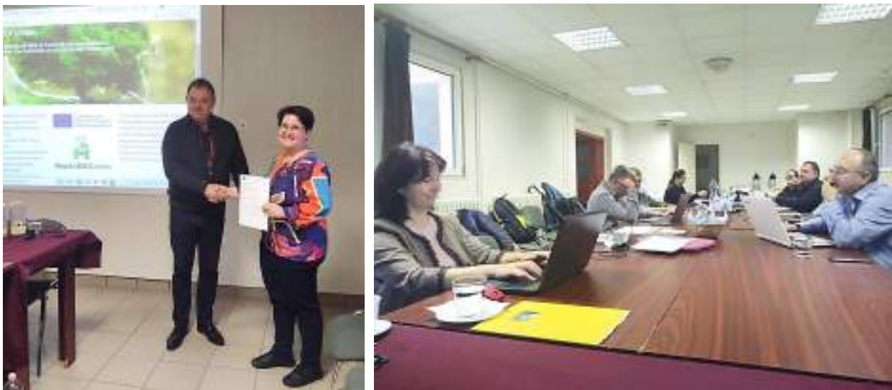
A doua întâlnire transnațională de lucru pe proiectul Hort4EUGreen, 07.10.2021