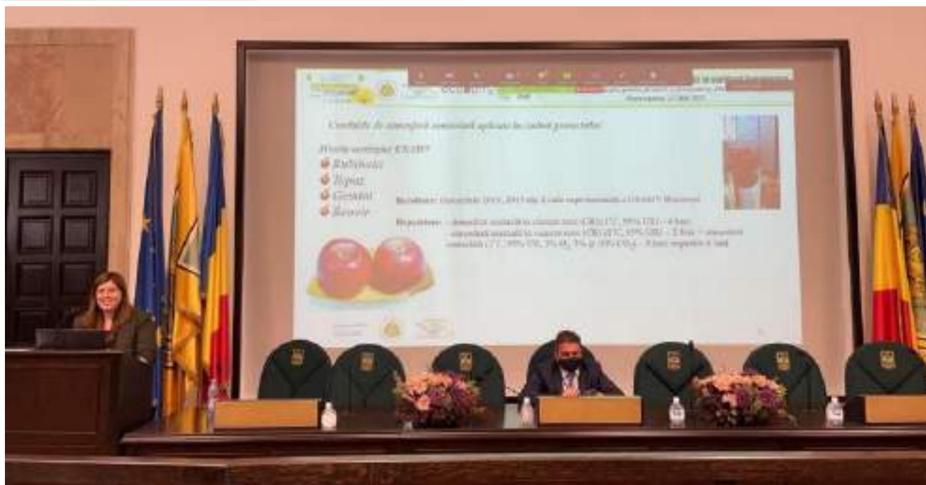
Organizare Sesiune de instruire Ecotehнопom