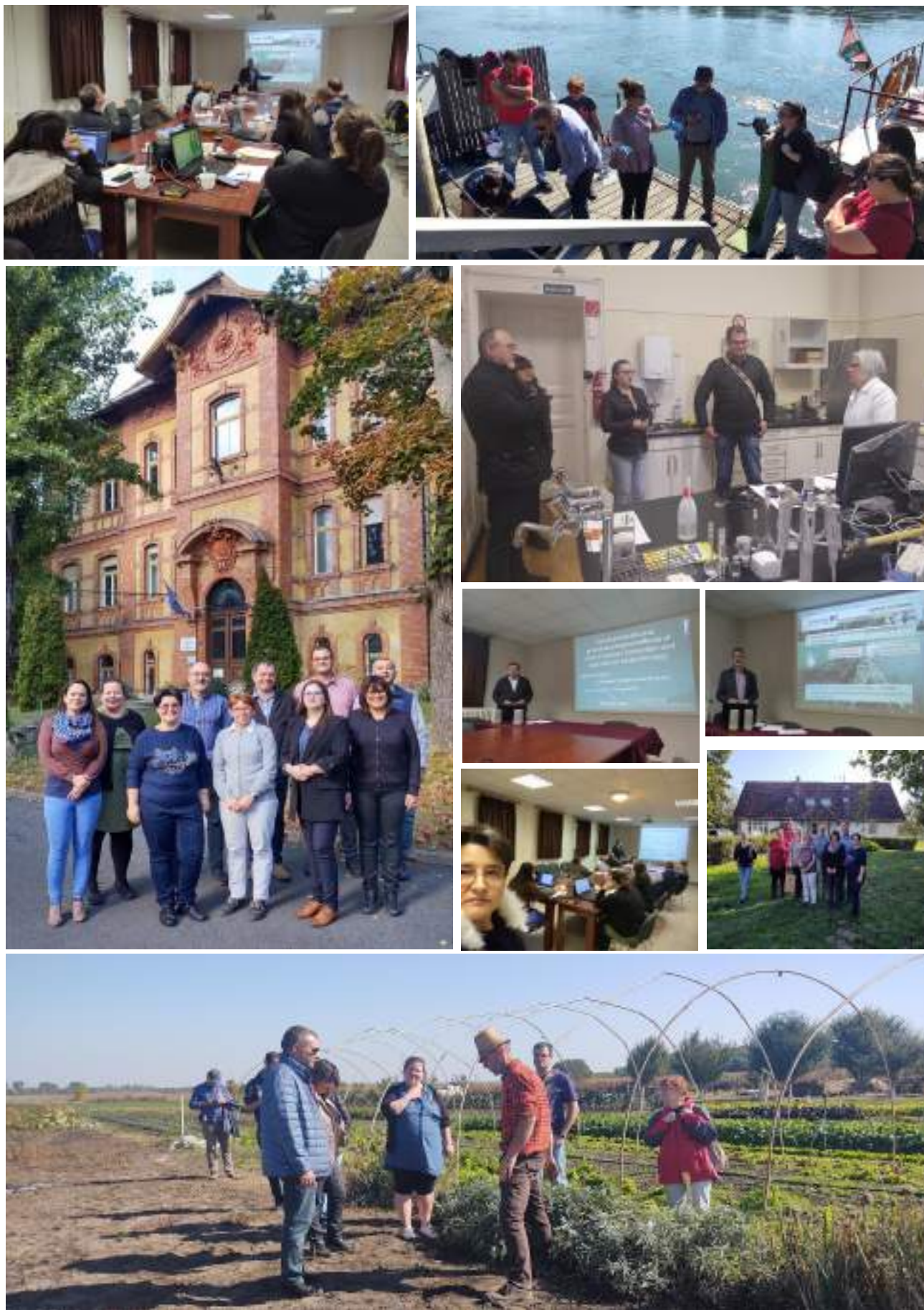
Aspecte din Intensive training on pesticide residues analysis – Budapest și C2 Present and future in pesticide residues analysis – Budapest, organizate pe proiectul Erasmus+ Hort4EUGreen