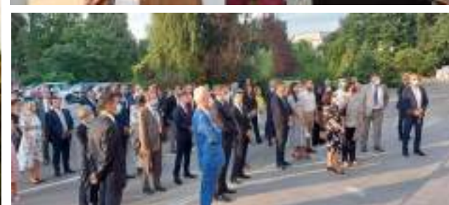
Organizare vizită de promovare cu ocazia Sărbătoririi Zilei Naționale a Elveției, în colaborare cu Ambasada Elveției