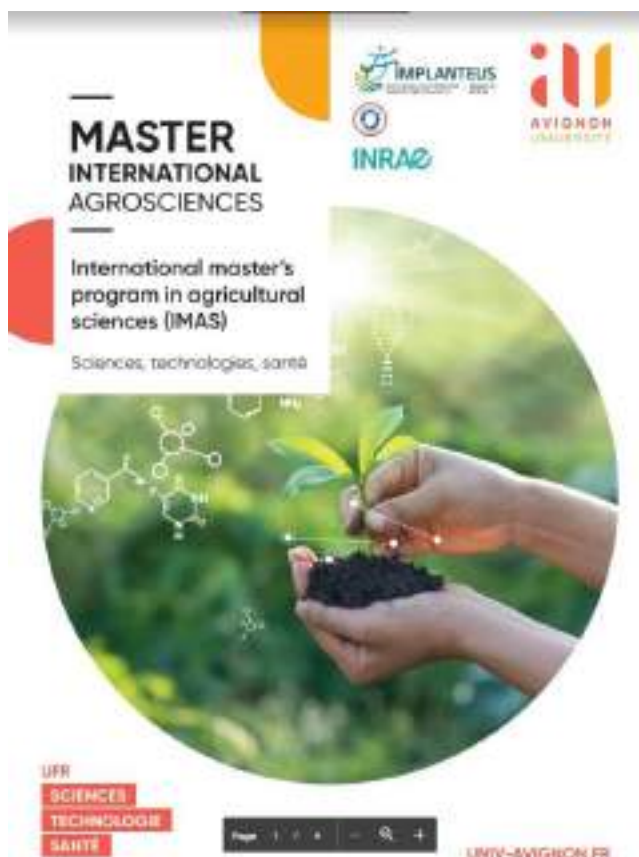
Sustinerea școlii universitare IMPLANTEUS prin schimburi de masteranzi și doctoranzi, cadre didactice și cercetători