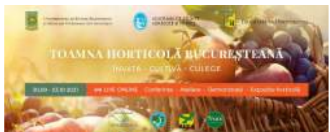
Organizare interviu PRO TV, Toamna horticola bucureșteană, 11.10.2021