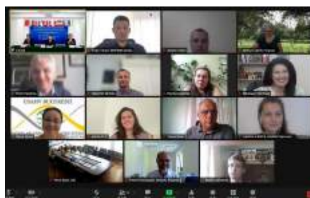
Participare la seminar on Intelligent Agriculture and Sustainable Development - 18-31.08.2021

Care este intenția participării la acest curs?