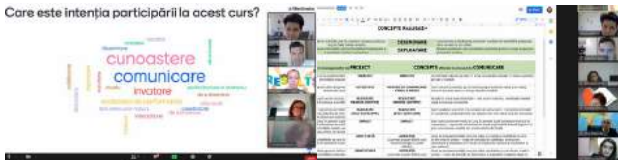
Participare Curs "RezultatE+ online, pentru proiectele aprobate în 2020 de parteneriat strategic", 20-25.5.2021, Agenția Națională pentru Programe Comunitare în Domeniul Educației și Formării Profesionale

Care este intenția participării la acest curs?