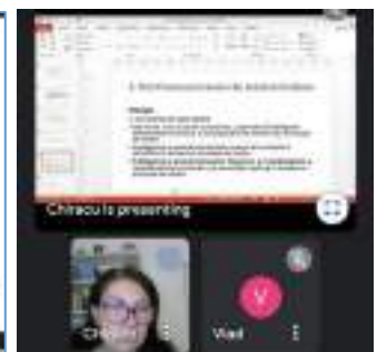
Proprietate Intelectuală și Industrială și Transfer Tehnologic bazat pe Transmiteri de Drepturi de Proprietate Intelectuală, 22-25.11.2021, USAMV București (online)