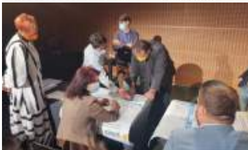
Reprezentare USAMV București la CNR UNESCO - "Educatie fara frontiere pentru dezvoltare durabila" – și atelierul "România la 100 de ani de la aderare", cu "Zilele Horticulturii Bucurestene - Hortus Florshow Romania/de 20 de ani in slujba comunitatii pentru dezvoltare durabila", 24-25 septembrie 2021, București,