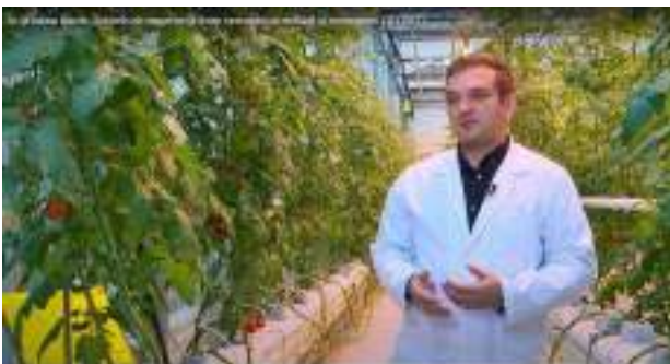
În direct la "În grădina Danei" (@TVR1) proiectul ClimaGreen